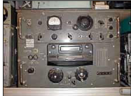
Р-250М = Кит-М