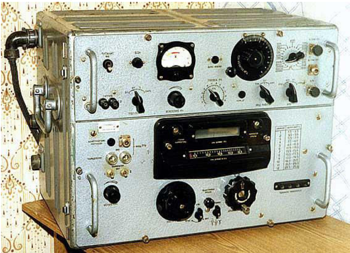
2. Р-250М = Кит-М