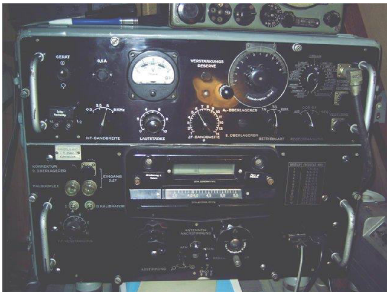
5. P-250M = Кит-М (ГДР)