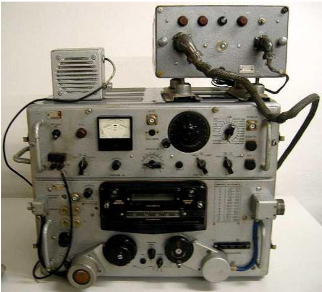
6. P-250 M2 с ДУ