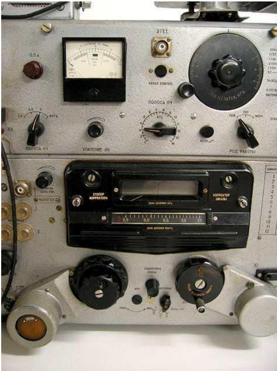
7. P-250 M2 с ДУ