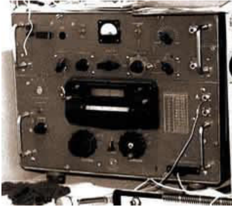
1. АС-1/2 = Р-250 = Кит