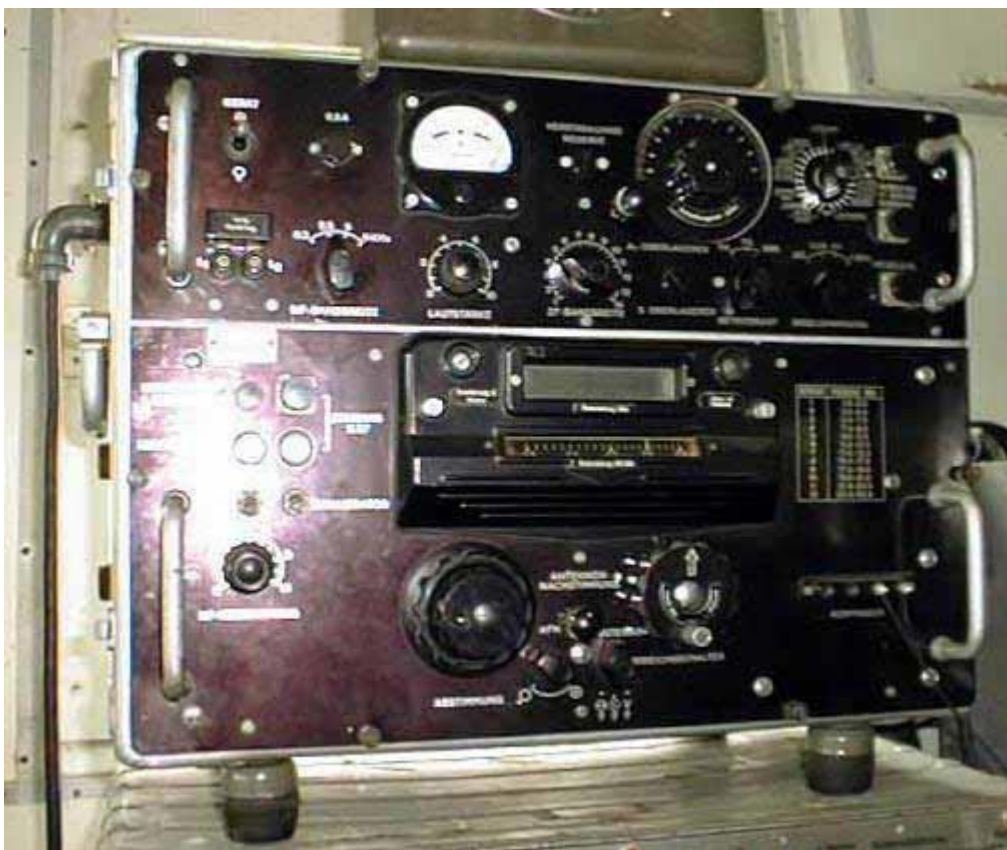
3. Р-250М = Кит-М (ГДР-овский вариант)